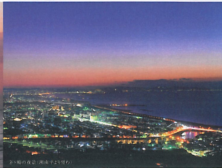
茅ヶ崎の夜景(湘南平より望む)