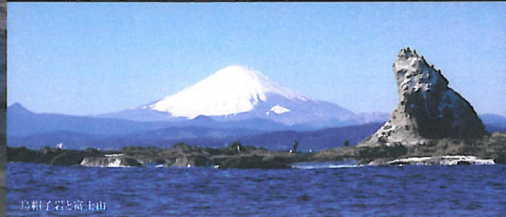
鳥帽子岩と富士山