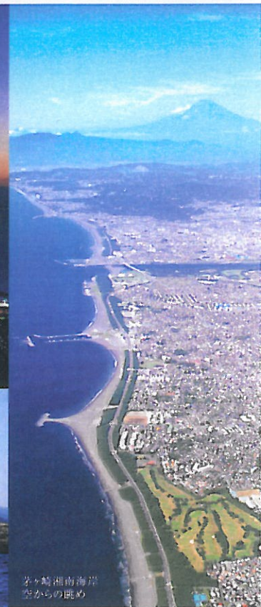
茅ヶ崎湘南海岸 空からの眺め