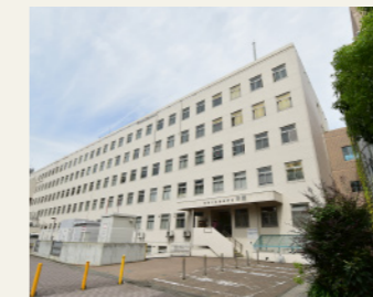
神奈川区役所(総合庁舎)