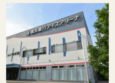
横浜銀行アイスアリーナ