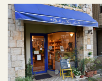
アトリエ菓舎(パン)