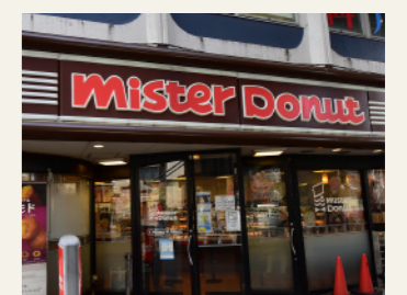
ミスタードーナツ