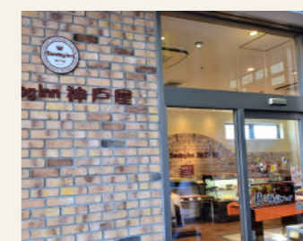
Sandog Inn 神戸屋(CIAL PLAT)