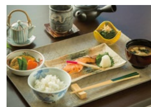
イメージ写真(昼食例)